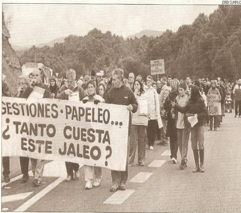
Dos centenars de manifestants van recórrer ahir el municipi de Castellbell contra els abusos municipals

Els manifestants van aturar-se a la Bauma per cantar unes nades